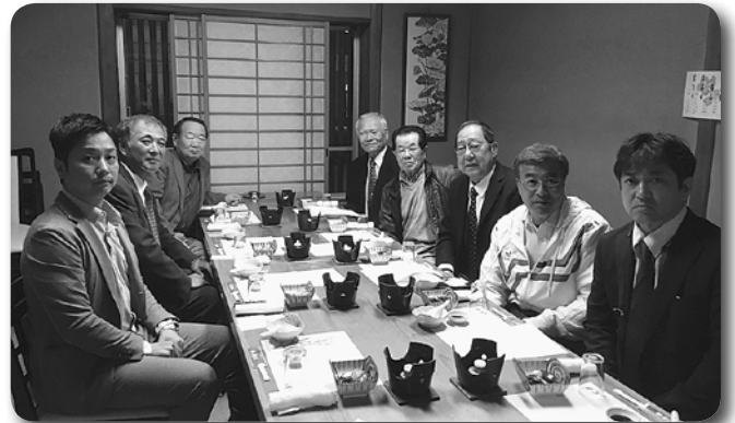
13 成田西支部役員会