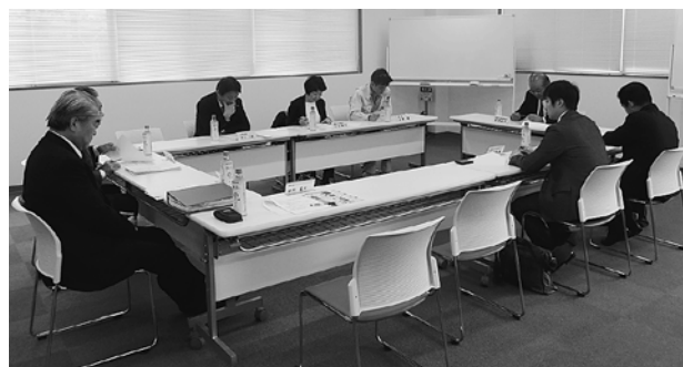
第3回地域社会貢献委員会の様子

また「白井市ふるさとまつり」や「八街市産業まつり」などの地域行事への積極参加や、広報委員会と連携して「税金クイズ」等の税の普及啓発活動を実施していく事とした。