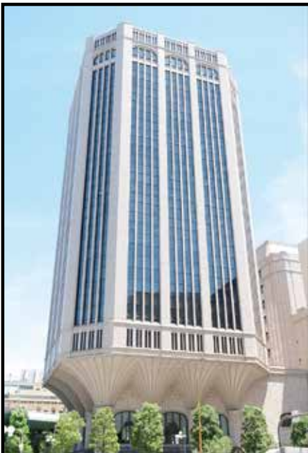
大同生命大阪本社ビル(大阪市西区江戸堀) ~加島屋が店を構えた地に建つ~

大同生命は1902(明治35)年に創業しました。 中小企業経営者のもしものときの力になりたい。 創業者の一人である広岡浅子が生命保険事業に託した 「社会の救済」と「人々の生活の安定」という想いは、 いまでも大同生命に受け継がれています。