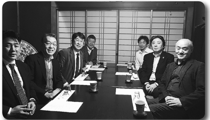
16 成田中央支部役員会