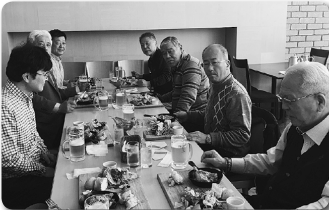
5 大栄支部異業種交流会