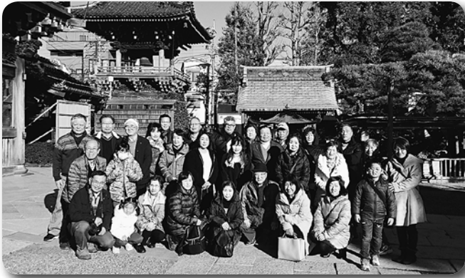
1 白井支部バス研修