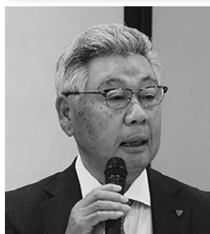
林 会 長