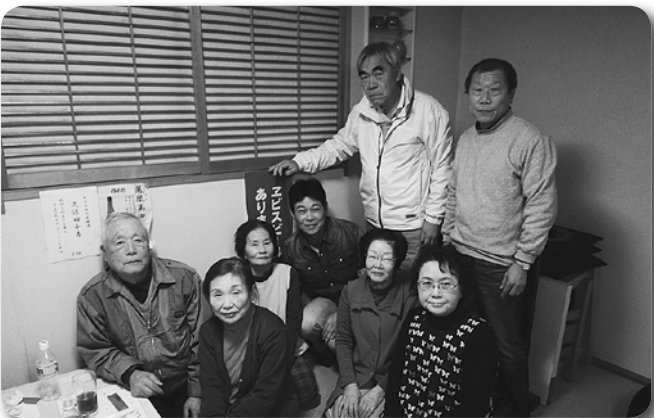
17 志津南支部役員会