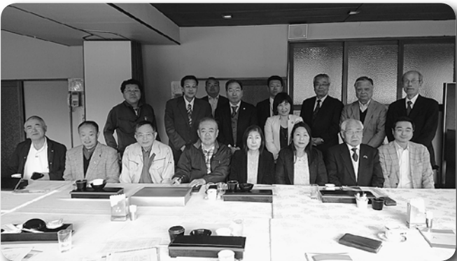
7 白井支部情報交換会