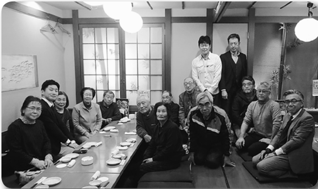
3 志津南支部役員会兼新入会員歓迎会