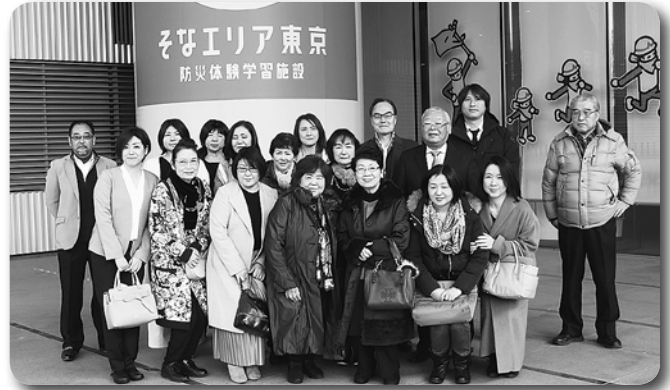
2 空港支部バス研修