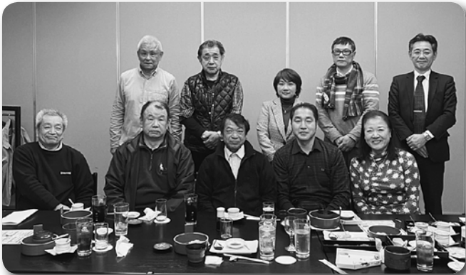
15 志津北支部役員会