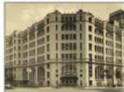
旧肥後橋本社ビル (設計:W・M・ウォーリス)