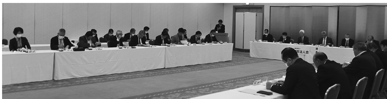
第3回理事会の様子