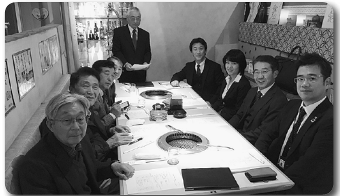
11 四街道東支部役員会