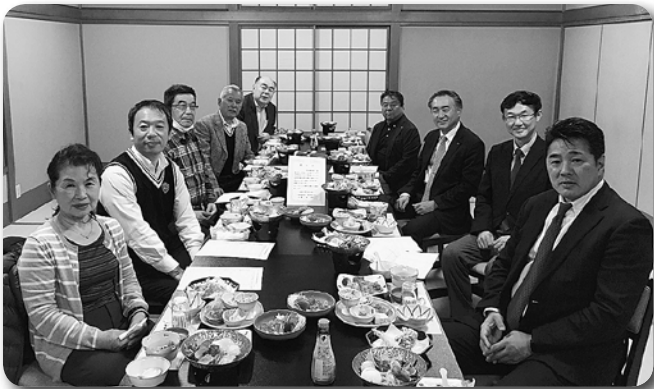
9 成田東支部役員会