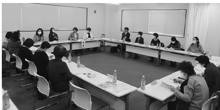
第4回女性部会役員会の様子

また、署長との意見交換会については11月18日に青年部会と共同で開催することとなった。