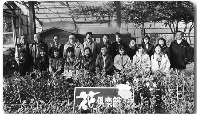
4 遠山支部新入会員歓迎バス研修