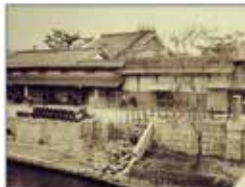
大同生命の礎を築いた 大坂の豪商「加島屋」