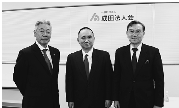
左から林会長、上理事長、宇都宮支部長