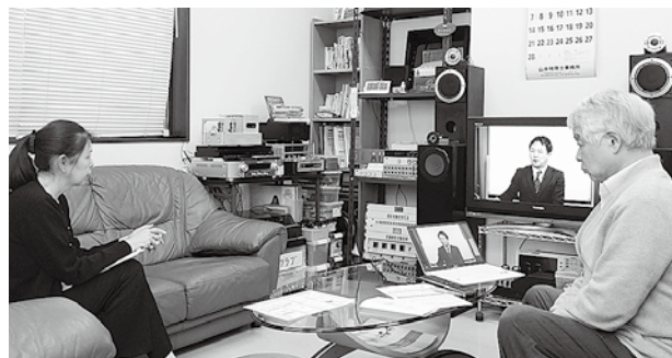
(株)ピーテックでの受講の様子