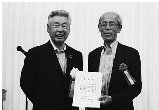
会員増強支部表彰の様子