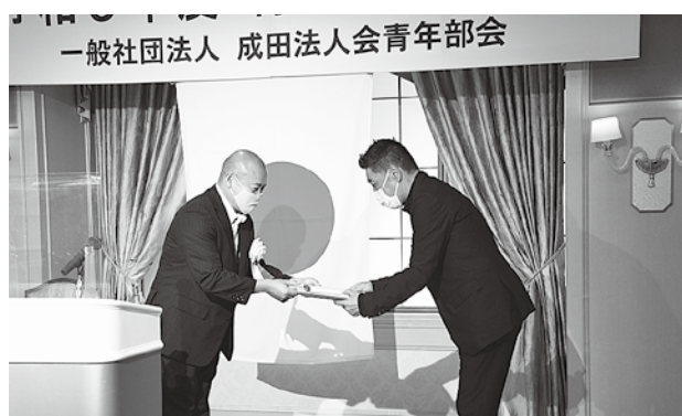
卒業生に記念品贈呈