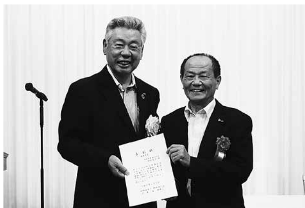
会員増強個人表彰の様子