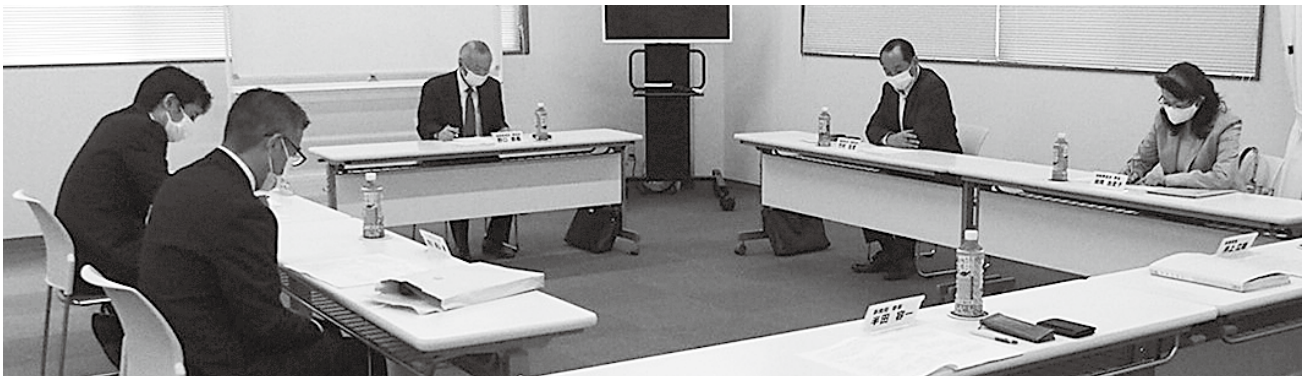
税制委員会の様子