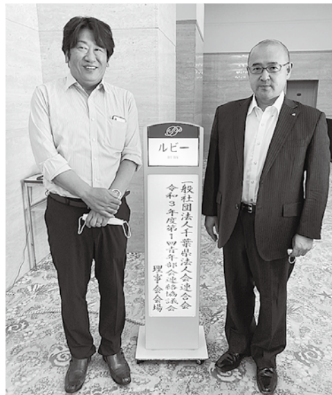
青年部会の出席者