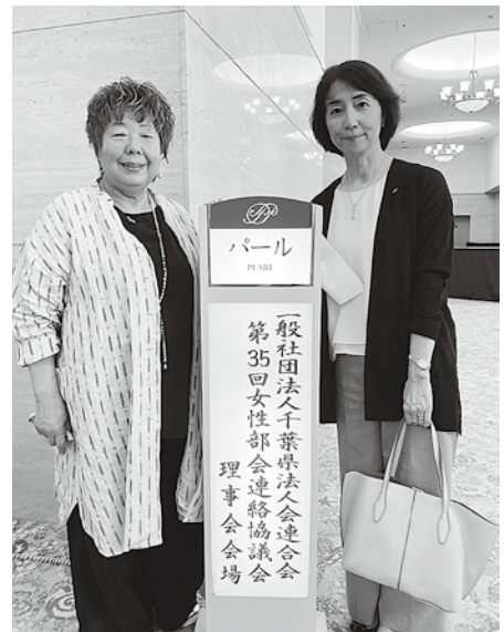
女性部会の出席者