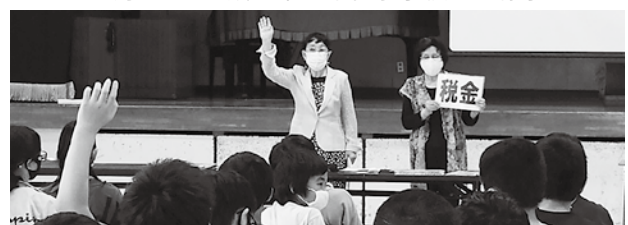
6月23日の佐倉市立下志津小学校での様子