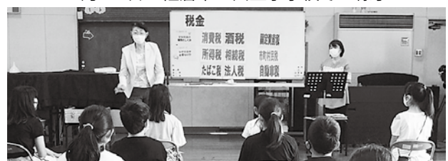
6月23日の成田市立中台小学校での様子